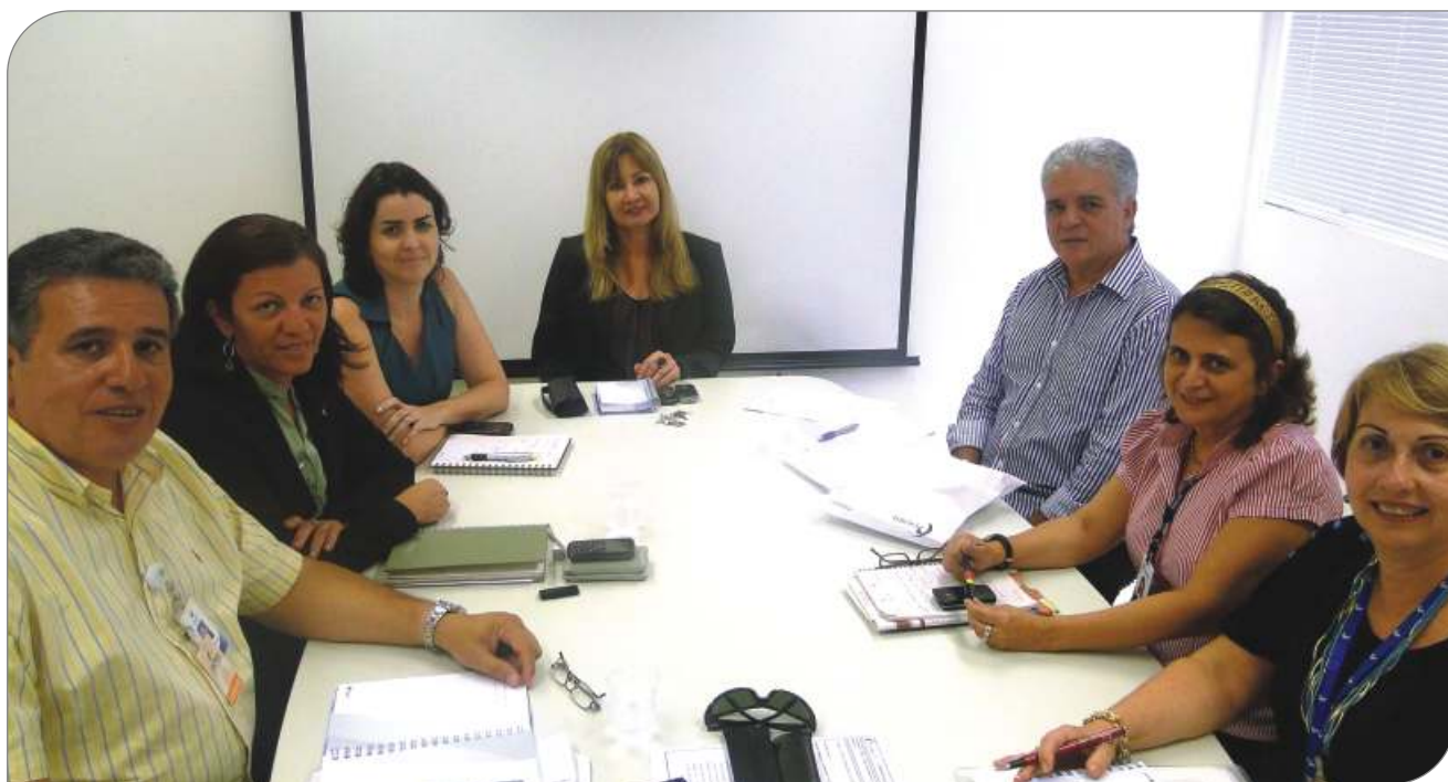
Gestores da Chesf e Fachesf ajustam novo modelo de atendimento 24h

O que muda no novo atendimento? A partir de agora, sempre que os usuários do Fachesf-Saúde e PAP se dirigirem a uma unidade de saúde credenciada, a autorização dos procedimentos será feita imediatamente por um dos atendentes da Fundação, independente da hora ou dia da semana, inclusive feriados. Esse modelo vai trazer ainda mais agilidade ao atendimento prestado e à comunicação entre a Fachesf e seus parceiros, e mais comodidade aos beneficiários; além disso, quando estiver em total funcionamento, será fundamental para otimizar o atendimento dos convênios de reciprocidade praticados por todas as empresas que compõem o Sistema Eletrobras. ■